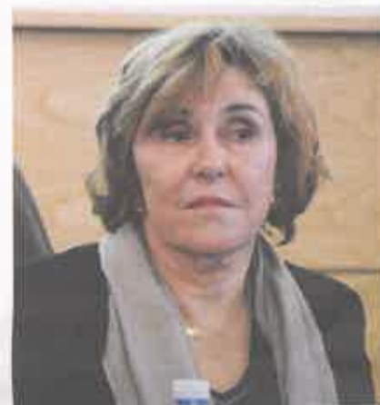
L'ex-Premier ministre Édith Cresson

Pas de goût aux études, pas de diplôme ? Rien n'est perdu ! Créées par le Premier ministre Édith Cresson en 1992, les Écoles de la 2 e chance E2C sont là. Elles ont pour vocation de permettre l'insertion sociale et professionnelle des jeunes de 18 à 25 ans, sans qualification ni emploi. Après un parcours de six mois dont 40 % en entreprise, la majorité des jeunes qui les intègrent parviennent à décrocher un diplôme, ou une formation.