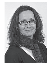
Vice - Président(e)